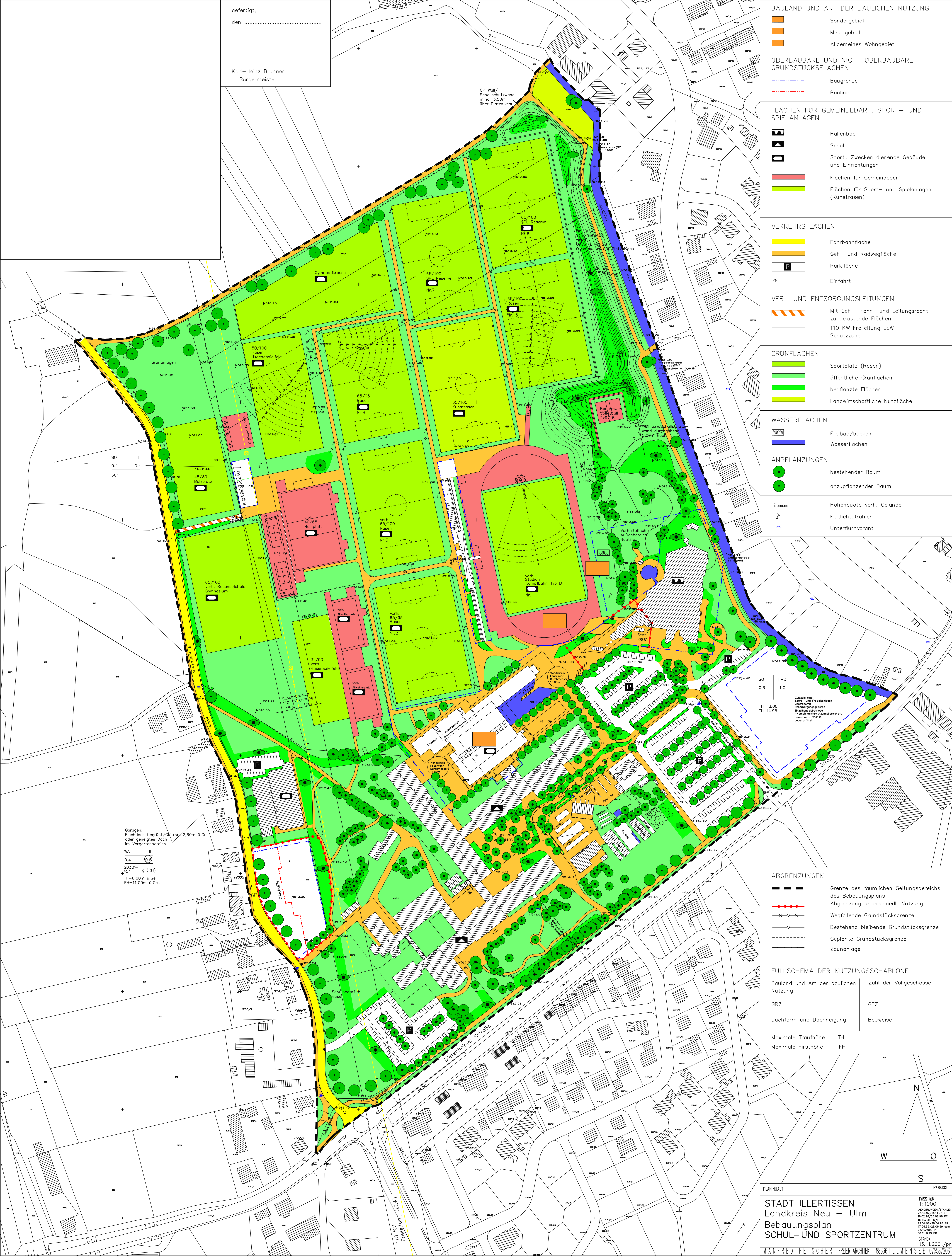
Lageplan zum Baugesuch Neubau Außensportanlagen 1. BA Stadt Illertissen